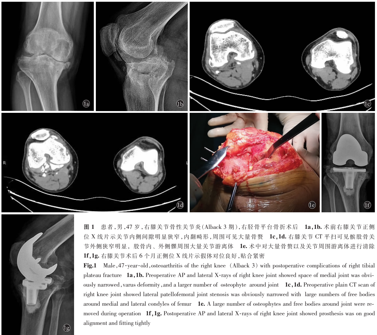
图 1 患者,男,47 岁,右膝关节骨性关节炎(Alback 3 期),右胫骨平台骨折术后 1a,1b . 术前右膝关节正侧位 X 线片示关节内侧间隙明显狭窄,内翻畸形,周围可见大量骨赘 1c,1d . 右膝关节 CT 平扫可见髌股骨关节外侧狭窄明显,股骨内、外侧髁周围大量关节游离体 1e . 术中对大量骨赘以及关节周围游离体进行清除 1f,1g . 右膝关节术后 6 个月正侧位 X 线片示假体对位良好,贴合紧密