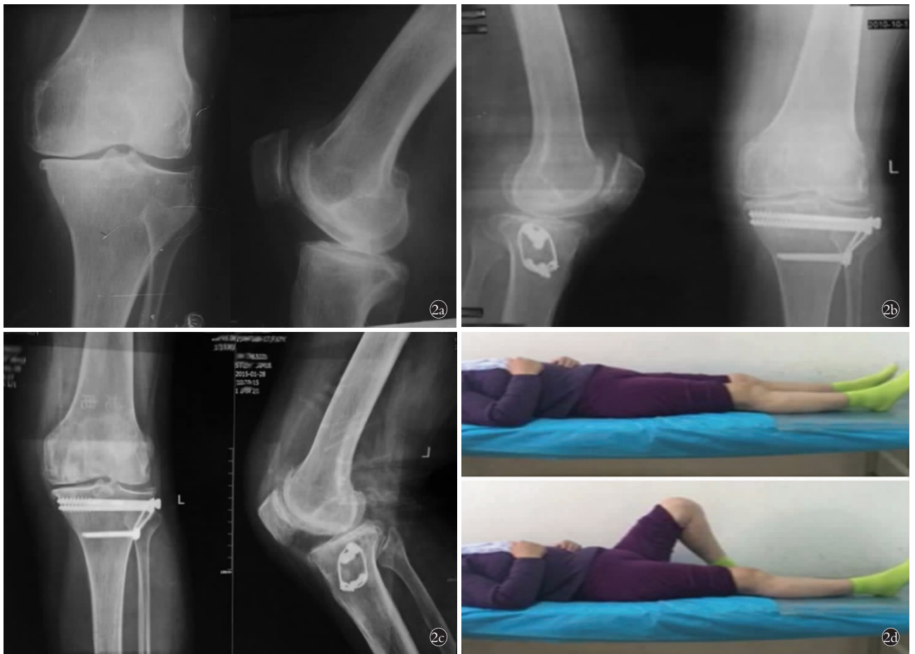
图 2 患者,女,45 岁,膝关节内侧间室骨关节炎 2a. 术前正侧位 X 线片示膝关节内侧间室 OA,内侧间室狭窄,外侧间室基本正常 2b. 术后 5 年膝关节侧位及正位 X 线片示膝关节内侧间室狭窄较术前减轻 2c. 术后 10 年膝关节正侧位 X 线片示膝关节内侧间室狭窄较术前减轻 2d. 术后 10 年随访膝关节活动度良好