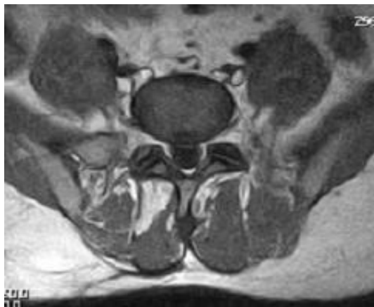
图 2 患者, 男, 46 岁, 复发腰椎间盘突出症。术后 7 年 MR 示带蒂脂肪片血供良好 Fig.2 A 46-year-old male patient with recurrent lumbar disc protrusion. Seven years after operation, MR showed that the blood supply of the pedicle fat grafts was satisfactory

MR 征象可见脂肪片覆盖于椎板缺损处, 椎管外少量瘢痕由椎板缺损处向椎管内延伸, 但与硬膜囊及神经根未形成致密粘连, 其中 1 例出现囊变坏死。其余 MR 示带蒂脂肪片血供良好, 均未出现囊变坏死 (图 2)。