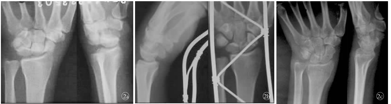
图 2 患者,男,49岁,舟骨骨折 2a. 治疗前正侧位 X 线片 2b. 手法整复固定后侧位及正位 X 线片 2c. 6 个月后复查 X 线片示骨折愈合