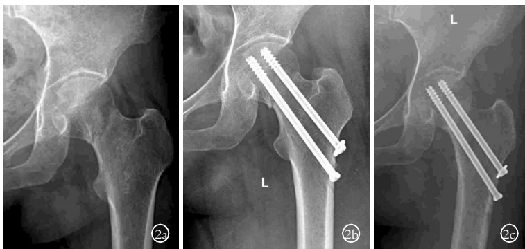
图 2 男, 52 岁, 左股骨颈骨折 2a. 术前正位 X 线片 2b. 仅行 2 枚空心螺钉内固定术 2c. 术后 10 个月正位 X 线片示骨折未愈合