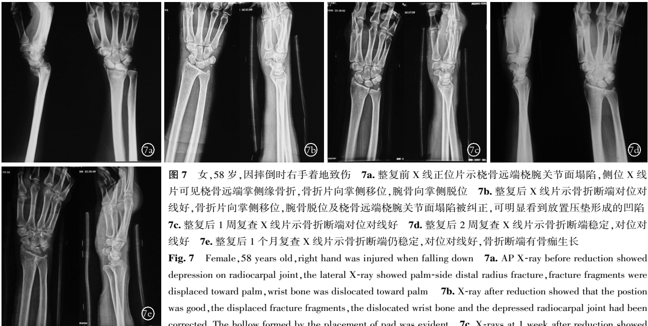
图 7 女,58 岁,因摔倒时右手着地致伤 7a. 整复前 X 线正位片示桡骨远端腕关节面塌陷,侧位 X 线片可见桡骨远端掌侧缘骨折,骨折片向掌侧移位,腕骨向掌侧脱位 7b. 整复后 X 线片示骨折断端对位对线好,骨折片向掌侧移位,腕骨脱位及桡骨远端腕关节面塌陷被纠正,可明显看到放置压垫形成的凹陷 7c. 整复后 1 周复查 X 线片示骨折断端对位对线好 7d. 整复后 2 周复查 X 线片示骨折断端稳定,对位对线好 7e. 整复后 1 个月复查 X 线片示骨折断端仍稳定,对位对线好,骨折断端有骨痂生长