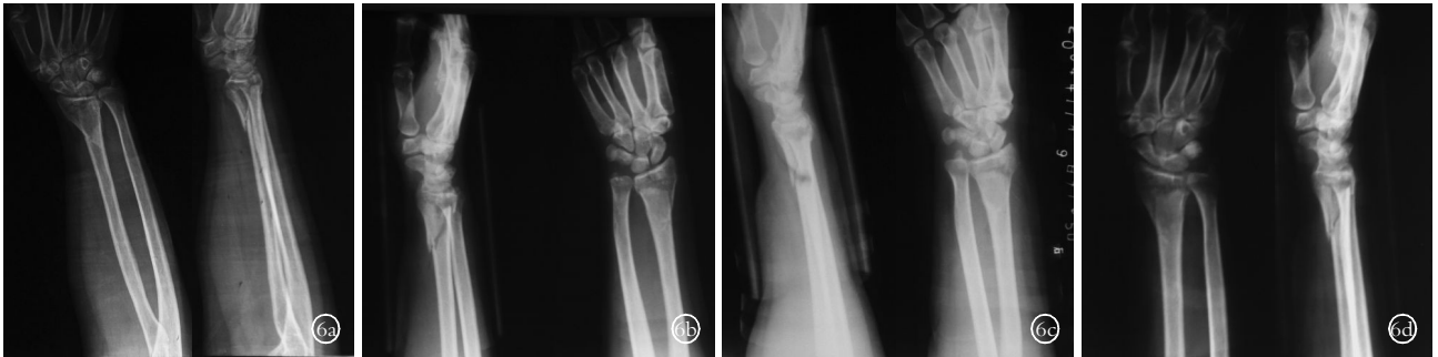
图 6 男,59 岁,摔倒时右手着地致伤 6a.复位前 X 线片可见桡骨远端掌侧缘骨折,骨折片略向掌侧移位,桡骨远端桡腕关节面塌陷 6b.整复后 X 线片示骨折断端对位对线好,骨折片向掌侧移位及桡骨远端桡腕关节面塌陷被纠正,可明显看到放置压垫形成的凹陷 6c.整复后 7 d 复查 X 线片示骨折断端对位对线好 6d.整复后 14 d 复查 X 线片示骨折断端仍稳定,对位对线好 6e.整复后 1 个月复查 X 线片示骨折断端仍稳定,对位对线好,骨折断端有骨痂生长

Fig.3 Placement of pad Fig.4 Fixation progress after placing cotton pad and splint Fig.5 Fixation completed