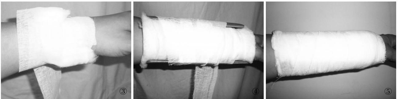
图 3 放置压垫 图 4 放置衬棉及夹板后固定过程中 图 5 固定完毕后

该类骨折对于复位及固定稳定的要求高,汤文杰等 [2] 认为应保证复位后桡腕关节面移位小于 2 mm,纸夹板材料独特。我们通过分析本组患者治疗情况后认为:纸夹板可根据肢体外形裁剪,使用灵活。4 层叠加的草纸板部分纤维吸水后变