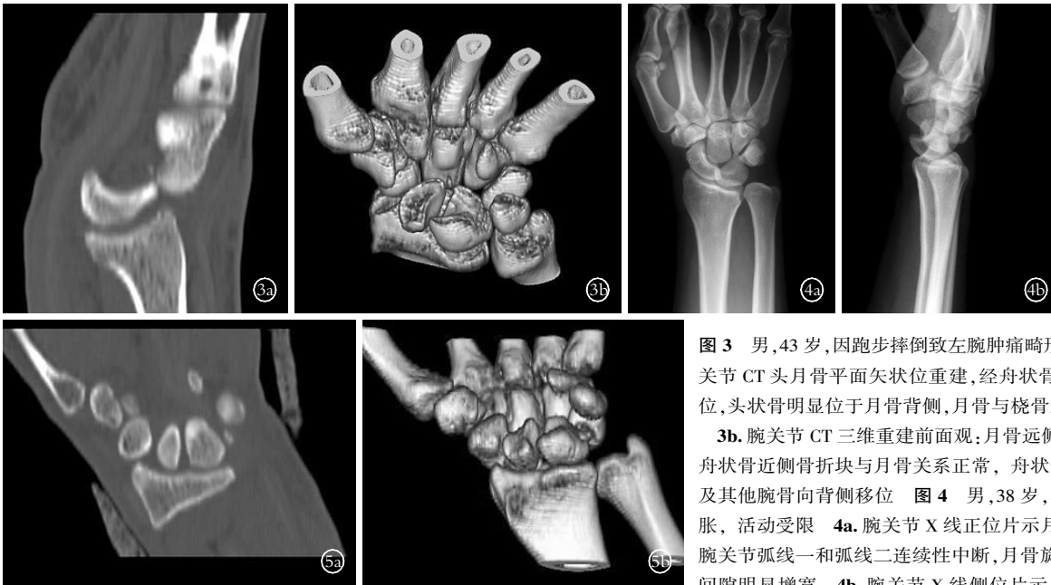
图 3 男,43 岁,因跑步摔倒致左腕肿痛畸形就诊 3a. 腕关节 CT 头月骨平面矢状位重建,经舟状骨、月骨周围脱位,头状骨明显位于月骨背侧,月骨与桡骨远端关系正常