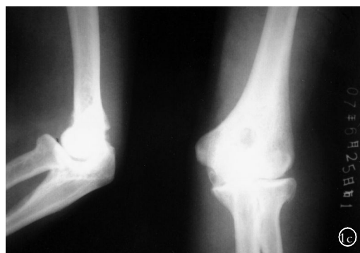
图1c 右肘术后正侧位X线片示肘前异常阴影消失,鹰嘴处有骨性增生阴影