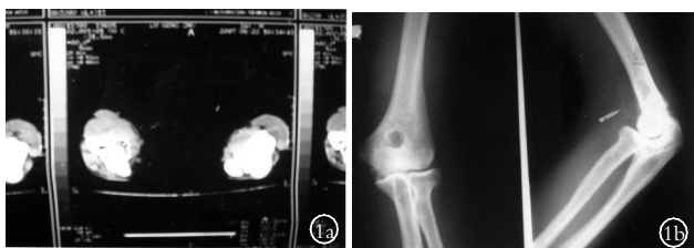
图1 男,33岁,右肘关节滑膜软骨瘤 1a.术前右肘CT片示椭圆形异常影 1b.右肘术前正侧位X线片

开关节囊见内有一3cm×1.36cm×2.35cm不规则骨块,质硬,呈灰白色,表面覆以软骨组织,与周围组织无粘连(见图2)。摘除骨性包块,见关节滑膜表面光滑,关节可见中等量微黄色积液,清洗后逐层缝合。术后病检:肿块由3层结构组成,外为纤维帽,其下为软骨帽,再下为骨板。病理诊断:滑膜软骨瘤。结果:术后随访0.5年,肘关节功能改善。X线片示:鹰嘴窝处有骨性增生阴影,余关节影像正常(见图1c)。