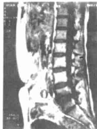
图 1 T 1 W 像信号减低

(3) MRI 本组 10 例。检查时间起病后 3~22 天, 平均 12 天, 9 例。起病后 13 月, 1 例。腰椎 MRI 检查, 常规矢状位和横截面成像。成像结果可分: ①T 1 W 像 感染椎间隙、相邻近椎体、硬膜信号明显减低, 椎板及附近软组织信号也有减低 (如图 1)。②T 2 W 像 感染椎间隙及邻近椎体、硬膜囊信号明显增强 (如图 2)。