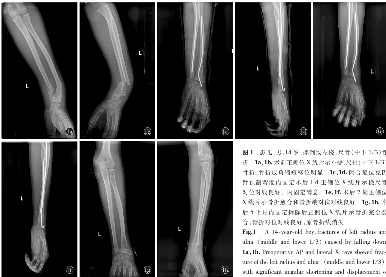
图 1 患儿,男,14岁,摔倒致左桡、尺骨(中下 1/3)骨折 1a,1b。术前正侧位 X 线片示左桡、尺骨(中下 1/3)骨折,骨折成角缩短移位明显 1c,1d。闭合复位克氏针预制弯度内固定术后 1 d 正侧位 X 线片示桡尺骨对位对线良好,内固定满意 1e,1f。术后 7 周正侧位 X 线片示骨折愈合和骨折端对位对线良好 1g,1h。术后 5 个月内固定拆除后正侧位 X 线片示骨折完全愈合,骨折对位对线良好,原骨折线消失

Fig.1 A 14-year-old boy, fractures of left radius and ulna (middle and lower 1/3) caused by falling down 1a,1b. Preoperative AP and lateral X-rays showed fracture of the left radius and ulna (middle and lower 1/3), with significant angular shortening and displacement of the fracture 1c,1d. One day after closed reduction and