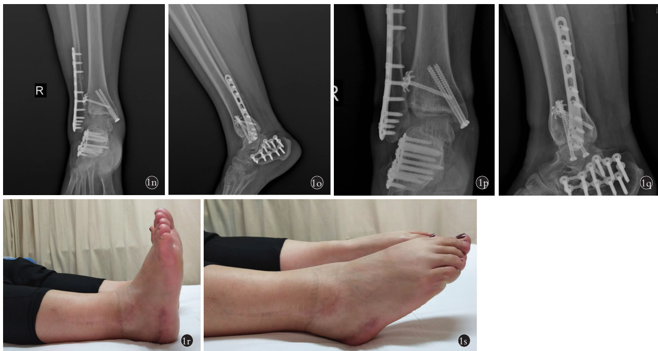
图 1 患者,女,29 岁,骑车摔伤致右踝关节旋前外展型Ⅲ度损伤,伴右跟骨、右锁骨粉碎性骨折 In, Io . 术后 12 个月右踝关节正侧位 X 线片 Ip, Iq . 术后 24 个月右踝关节正侧位 X 线片示骨折愈合良好,钢板螺钉位置良好,踝关节关系正常 Ir, Is . 术后 24 个月外观图示右踝关节背伸、跖屈功能正常