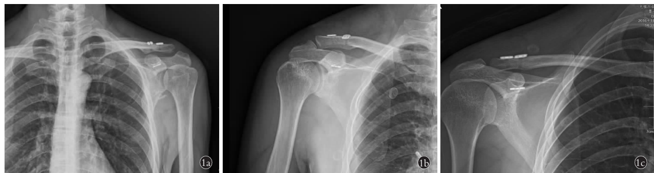
图 1 即刻复位效果(术后 1 周内肩锁关节复位效果 X 线评估) 1a. 以锁骨远端略高于肩峰为复位不足 1b. 以锁骨远端与肩峰弧线光滑为完全复位 1c. 以锁骨远端低于肩峰为复位过度