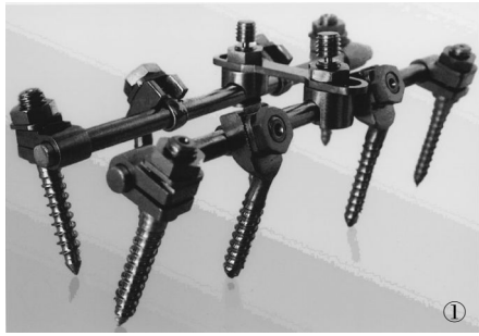
图 1 弧轨自锁椎弓根矫形固定器 II (ALPF II)