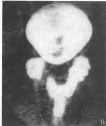
图 1b 术后所见右侧椎板“开门”, 左侧椎板(门枢)青枝骨折, 保留后韧带结构, 椎管矢状径 1.70cm, 截面积 1.75cm 2 , 硬膜囊膨隆, 侧隐窝扩大。