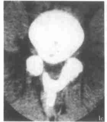
图 1c 术后一年所见右侧椎板与棘突、左侧椎板已骨性愈合。