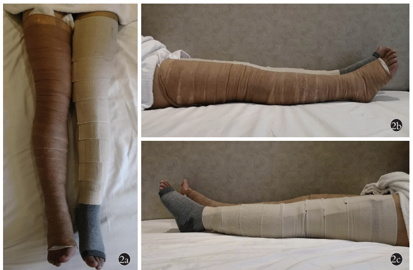
图2 试验中效果图 2a. 正位图,左腿为加压治疗支具,右腿为3M弹力绷带改良罗伯特绷带 2b. 右腿3M弹力绷带改良罗伯特绷带侧位图 2c. 左腿加压装置的侧位图,两组绷带均平整贴服于下肢

按照 Charalambides 等 [5] 研究结果,有效的加压范围应该从足趾到大腿中段,所以根据研究对象的下肢长度和周长,组合足踝加压模块、内衬模块和外衬模块,统计试验组组合后在长度和宽度对研究对象的包裹的适体性。两组均由同1位经验丰富的临床医生各包扎1次,记录首次组配装置时间和打开装置再次安置时间,两组当肢体出现剧烈疼痛或感觉麻木时解除不适侧的包扎,记录各组出现次数和调整所需时间。采用压力性损伤分期 [11] 方法评估研究对象24 h后局部皮肤压力性损伤,比较两者应用后的安全性差异,压力性损伤分为4期:1期,皮肤完整,局部出现指压不变白的红斑,在深色皮肤表现可能不同;2期,部分皮层缺损伴真皮层外露;3期,皮肤全层缺损,脂肪组织外露,通常可见肉芽组织或创缘内卷,局部也可有腐肉和(或)焦痂;4期,全层皮肤和组织缺损形成的溃疡,伴有可见或可触及的筋膜、肌肉、肌腱、韧带、软骨或骨外露,局部也可有腐肉和(或)焦痂。还有不可分期的压力性损伤:损伤程度不明的全层皮和深部组织压力性损伤,持续指压不变白的深红色、栗色或紫色。采用视觉模拟评分法(visual analogue scale, VAS) [12] ,在0.5、1、2、4、6、12、24 h这7个时间点记录研究对象主观疼痛感觉变化,来评估使用后舒适性。