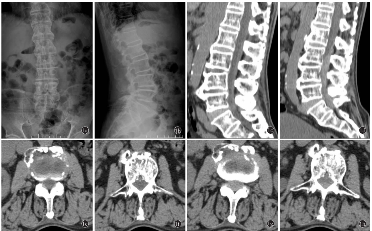
图 1 患者,男,75 岁,腰椎管狭窄症 1a,1b . 骶管封闭术前腰椎正侧位 X 线片显示腰椎退变、骨质增生,呈竹节样改变 1c,1d . 分别为骶管封闭术前和术后 2 d 腰椎 CT 二维重建片,术后 2 d 腰椎 CT 二维重建可见 L 3 -S 1 椎管内后缘见条状物,密度较 L 1 节段脊髓信号稍高 1e,1f,1g,1h . 分别为骶管封闭术前( 1e,1f )和术后 2 d( 1g,1h )腰椎 CT 椎间盘 L 3,4 节段和 L 3 椎体下 1/3 横断面,骶管封闭后硬膜和黄韧带间隙与术前比较明显狭窄甚至消失

硬膜外血肿是腰椎术或椎管内阻滞术后不常见的并发症,血肿压迫脊髓后出现神经功能缺损症状,可见下肢无力、感觉障碍、排尿排便困难等,一旦发生未能及时发现与治疗可出现神经不可逆损害,截瘫或四肢瘫痪 [1] 。本病发病年龄范围广,病因复杂,大量文献报道与抗凝药的使用有关,此外血管畸形、血液病、高血压病、外伤等也可导致椎管静脉丛或动脉破裂出血引发病 [2-3] 。腰椎间盘突出症占腰腿痛的 54%~80% [4] ,可出现腰背部疼痛、下肢活动及感觉障碍,病重者可致残,严重影响患者生活质量。硬膜外类固醇注射通过抑制磷脂酶 A2 来达到抗炎的效果,中断疼痛-痉挛循环和中枢神经活动模式,对