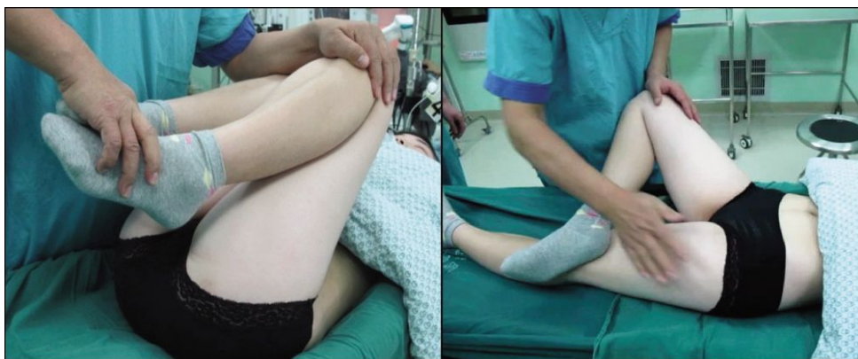
图 1 麻醉状态下对患者双侧髋关节进行推拿活动 Fig.1 Manipulation and mobilization for bilateral hip joints under anesthesia